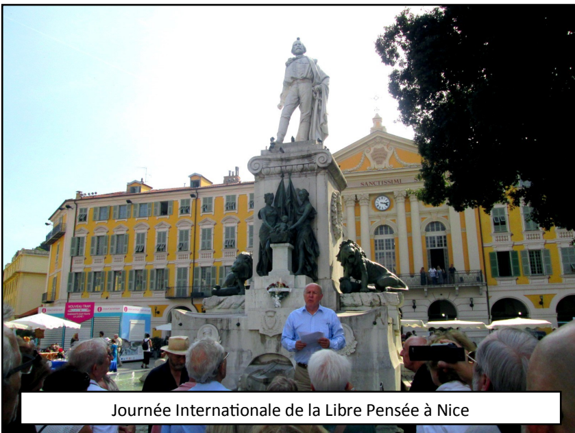
Journée Internationale de la Libre Pensée à Nice

D'après l'Organisation Internationale pour les Migrations, plus de 89 800 Iraquiens ont été récemment déplacés de Salah al-Din (districts de Baiji et d'Al-Shirqat) et de Ninewa (sous-district d'Al-Qayara) entre le 16 juin et le 4 septembre 2016. Ces déplacements s'ajoutent aux plus de 3,3 millions d'Iraquiens déjà déplacés à travers le pays depuis janvier 2014.